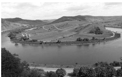
Abb: Moselschleife an unserer Weinlage Abtei-Kloster-Stuben.

Das zurückliegende Weinjahr bricht gleich zwei Rekorde. Zum einen ist es die früheste Lese seit Menschengedenken, zum anderen fällt die Erntemenge so niedrig aus wie nie zuvor in den vergangenen fünfzig Jahren.