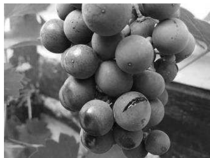
Abb: Aufgeplatzte Beere kurz vor Pilzinfektion.

Der Juli brachte den lang-ersehten Regen. Rasend schnell erfolgte die Traubenentwicklung. Schwülheiβes Wetter mit viel Niederschlag beschleunigte die Traubenentwicklung weiter. Ein aufplatzen der Beeren sorgte wieder für erneute Anspannung der Lage. Angesichts der hohen Fruchtzuckerwerte und des sich schnell ausbreitenden Pilzbefalls begannen, vor allem Trauben- und Fassweinerzeuger, schnellstmöglich mit der Lese, um weiteren Mengeneinbußen zuvor zu kommen.