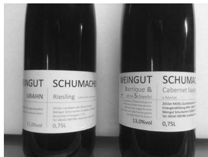
Abb: Die zwei „Mittelalterlichen“! L772 u. R217

Das ergänzende rote Pendant hierzu unser „Cabernet-Sauvignon x Merlot Schwefelfrei“ (Wein R217)!