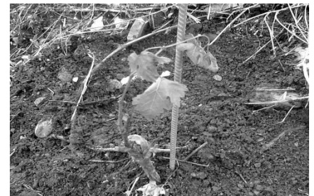
Abb: Frostschaaden am jungen Trieb

Die Pessimisten unter uns sehen in diesem Umstand allerdings eine extreme Gefahr. Die Anfälligkeit des Rebstocks gegenüber den gefürchteten Spätfrösten steigt.