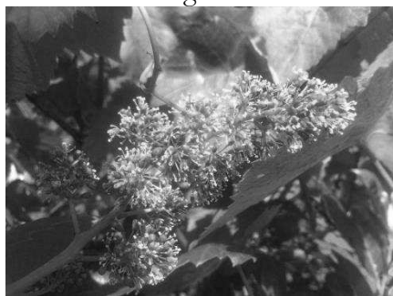
Abb: Traubenblüte ende Mai.

unseren Steillagen bis hin zum Tiefschlag mit partiellem Totalausfall. Besonders hart traf es unsere Bremmer-Abteikloster-Stuben, der mit dem roten Spätburgunder bepflanzt ist, und den zweiten herben Knockdown in Folge erlitten hat. Nur einen sehr glücklichen Umstand verdanken wir, dass unser Spätburgundervorrat dennoch gesichert ist: