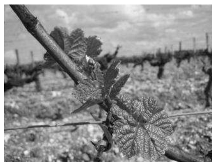
Abb: Austrieb der Rebe Anfang April

die ebenfalls warmen Tage der ersten Aprilhälfte forcierten eine zügige Entwicklung der Reben. Bereits Anfang April verzeichneten wir den ersten Austrieb im Neefer Frauenberg, -fast vier (!) Wochen früher als im langjährigen Mittel von 2006-2016.