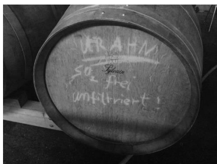
Abb: Das „Urahn-Fass“

Es ist ein Riesling gemacht wie damals, als man noch keine Weinfilter und noch keinen Schwefelzusatz kannte. Gelagert, gereift und mikrobiologisch stabilisiert in einem Holzfass. Es ist ein Riesling unfiltriert und ohne Schwefel.