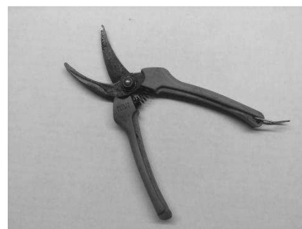
Abb: Traubenscheere für die Handlese und Selektion einzelner Beeren mit der spitzen Klinge.

Stichwort Ernte, die Weinlese stellt uns jedes Jahr aufs Neue vor neue Herausforderungen. So begannen auch wir so früh wie nie zuvor mit den ersten Lesedurchgängen, um faule Trauben zu entfernen. Wir nennen das die „negative Selektion“. Sie fordert geübte Leserinnen & Leser, der Aufwand ist riesig. Die Erntehelfer mussten jede Traube unter die Lupe nehmen, um die passenden Beeren für den entsprechenden Weinstil auszuwählen.